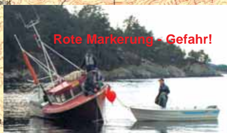
Rote Markierung - Gefahr!

Notruf: Polizei 112 Terje 00 47 928 57 007 Berit 00 47 928 57 008