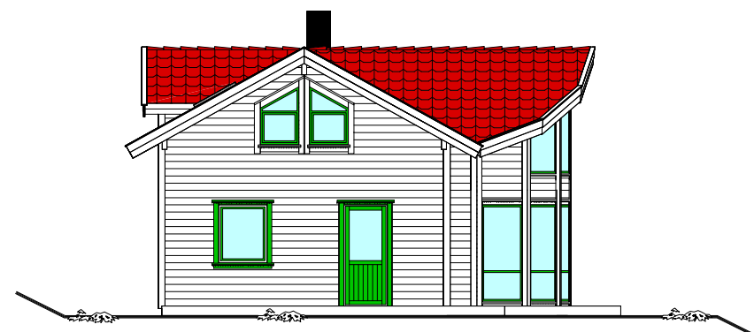
FASADE MOT NORD